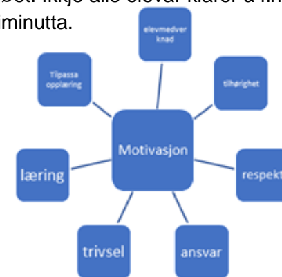
Denne modellen viser kva faktorar som har innverknad på motivasjonen.

Vi som jobbar i skulen kjenner oss igjen i at elevane sin motivasjon endrar seg etter kvart som dei blir eldre. Ved å ha fokus på elevmotivasjon, og særleg elevmedverknad, vil skulane kunne gjere ein innsats som bidrar til å betre elevane sin motivasjon til å lære.